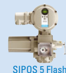
SIPOS 5 Flash